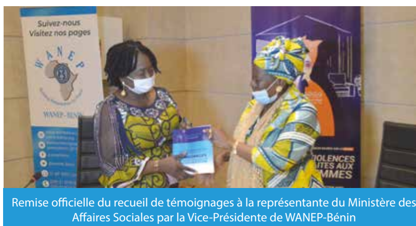
Remise officielle du recueil de témoignages à la représentante du Ministère des Affaires Sociales par la Vice-Présidente de WANEP-Bénin

Au cours de ce forum, deux (02) outils de sensibilisation et d'appel à la dénonciation ont été lancés. Il s'agit d'un recueil de témoignages illustré intitulé «Harcèlement Sexuel en Milieu de Travail : Témoignages» et d'un slam-vidéo de dénonciation. L'élaboration du recueil a connu un processus participatif des victimes et renferme 13 témoignages décrivant les manifestations et les conséquences du harcèlement sexuel en milieu de travail. Le slam vidéo, quant à lui, a été composé par de jeunes slameurs béninois. Sa diffusion a permis de toucher plus de 17000 personnes. Il est accessible sur Youtube à l'adresse https://www.youtube.com/watch?v=W7EgdSbajh0&t=3s .