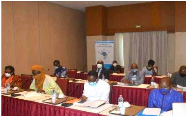
Vue partielle des participants à l'installation du Groupe National de Réponse Electorale

Les actions menées dans ce domaine entrent dans le cadre du projet Electoral violence Monitoring Analysis and Mitigation (EMAM) et ont consisté, essentiellement, en la mise en place et fonctionnement du Groupe National de Réponse Electorale (GNRE). Le GNRE est composé de vingt (20) personnalités dont dix (10) responsables d'OSC et dix (10) autres acteurs, personnes physiques et/ou représentants des institutions, ciblés et mobilisés pour leurs expériences en matière électorale, des droits humains, de la sécurité, etc. et/ou leurs capacités à influencer la réponse une fois que les risques liés à la violence électorale sont identifiés.