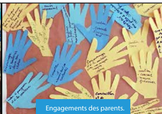
Engagements des parents.