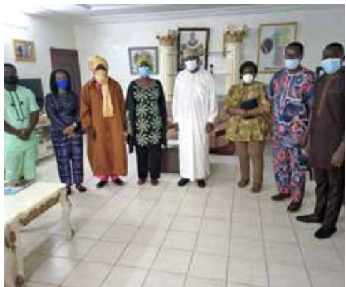
Audience du groupe National de Réponse Electorale (GNRE) avec l'ancien Président Boni YAYI