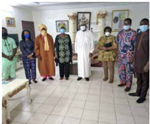
Audience avec l'ancien Président Boni YAYIde Réponse Electoral