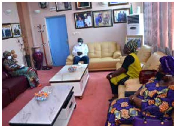
Audience à la Cour supreme

Il a pour mission de travailler pour une élection présidentielle libre, inclusive, pacifique et transparente en 2021 au Bénin. Le Groupe a été officiellement installé à Cotonou le 25 septembre 2020. D'octobre à décembre 2020, le GNRE a :