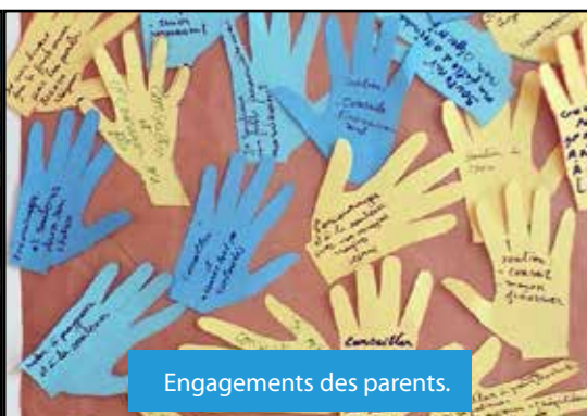
Engagements des parents.